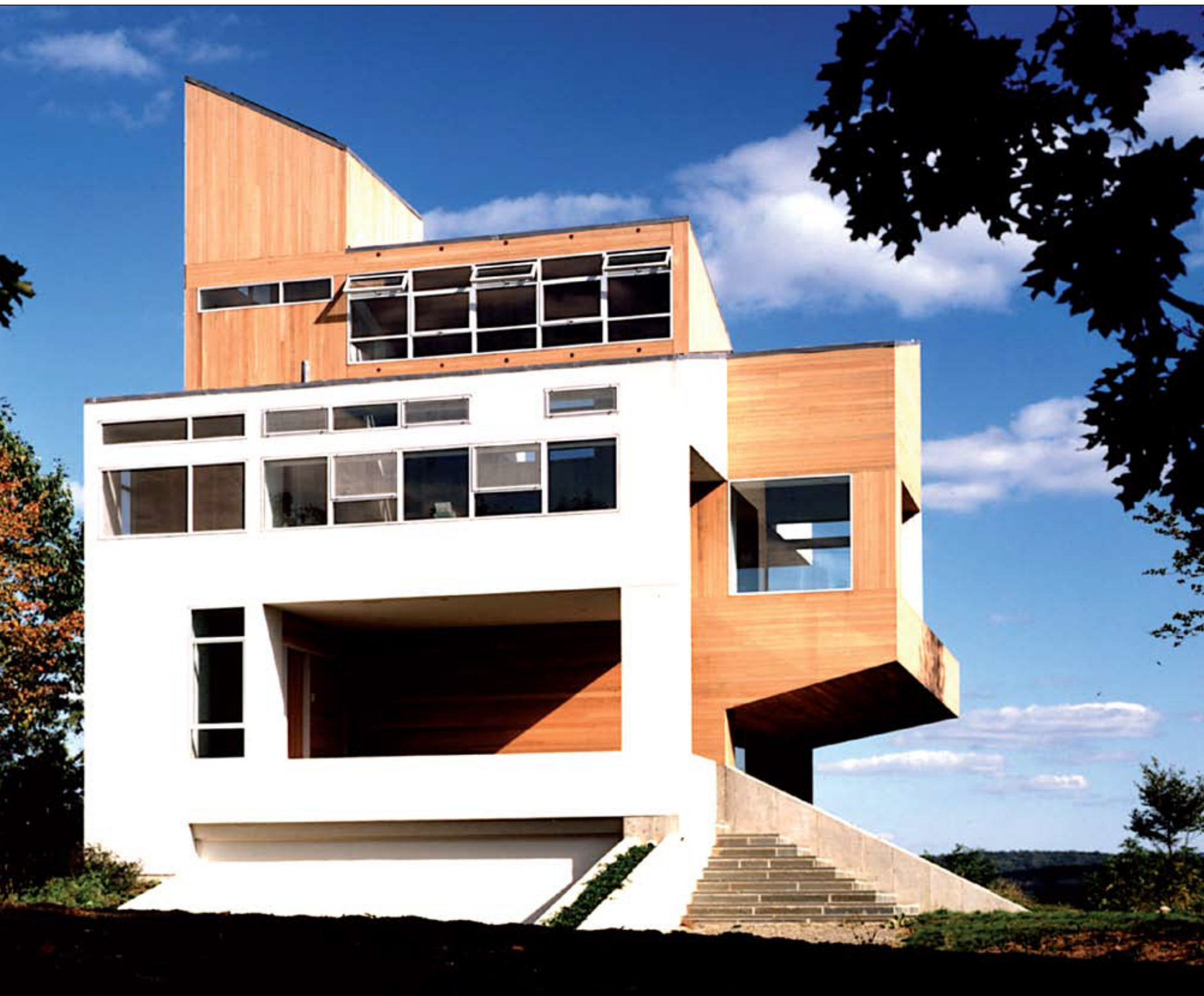
Nahoře: Vertikální a horizontální linie Patricia Lane House postavené v roce 1998 v Clinton Corners prořezávají okolí a umožňují neobvyklé výhledy ze všech stran domu.